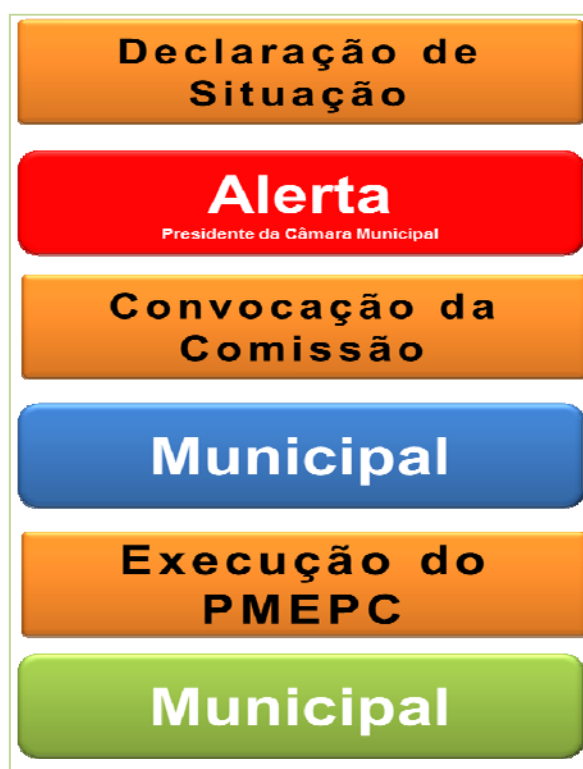
Figura 4 – Sequencia de Declaração de Situação de Alerta de âmbito Municipal

Apresenta-se na Figura 3, de forma esquemática, o procedimento a cumprir de acordo com a natureza dos acontecimentos. Os critérios e âmbito em que ocorre a declaração das situações de alerta, encontram-se definidos na Lei de Bases da Proteção Civil (Lei n.º 27/2006, de 3 de Julho), apresentados na Tabela 6.