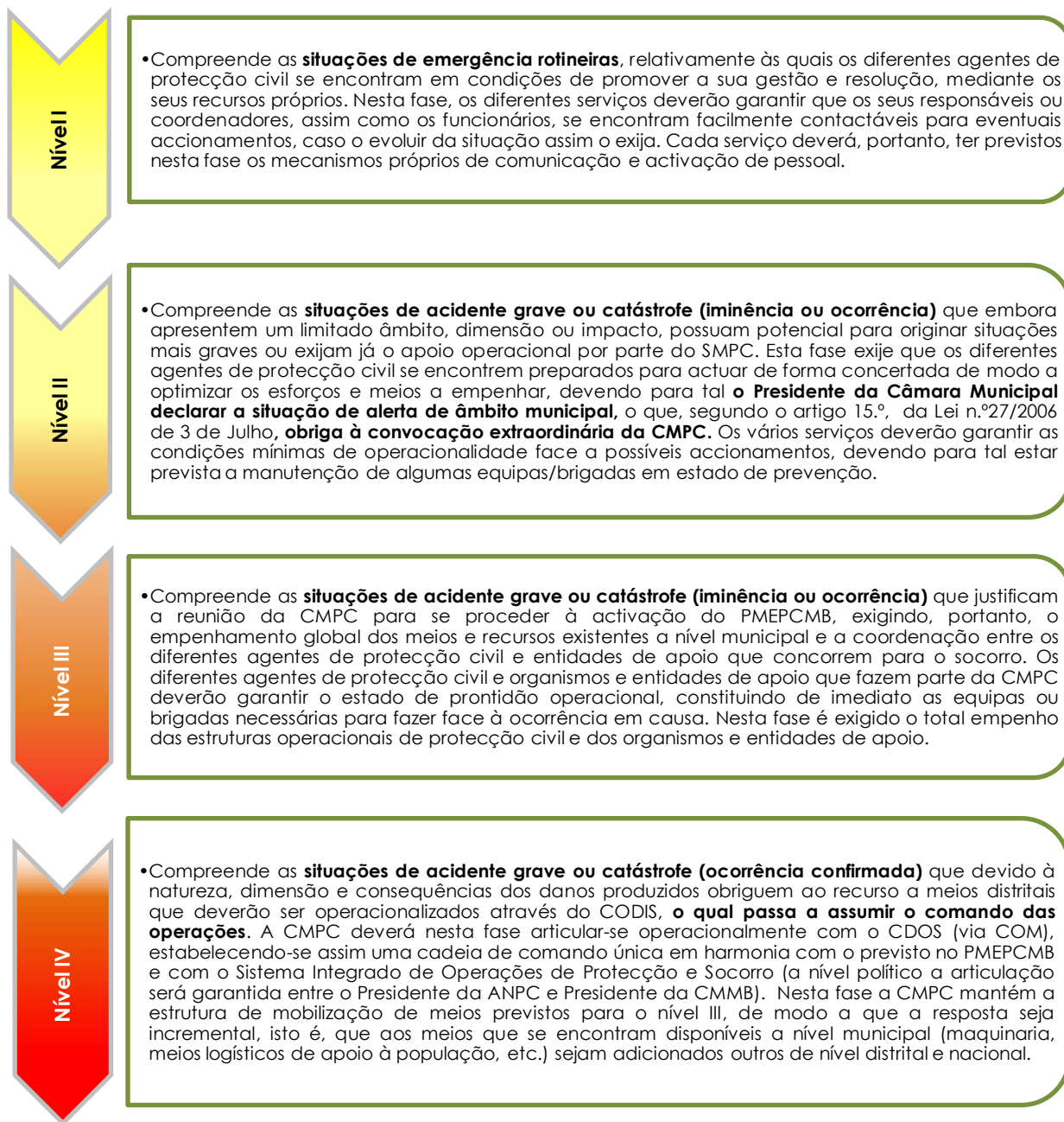
Figura 2. Níveis de intervenção na fase de emergência