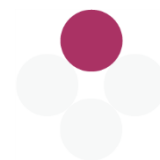
Quadro 5 | Meios de divulgação da publicitação da ativação/desativação do PMEPCS