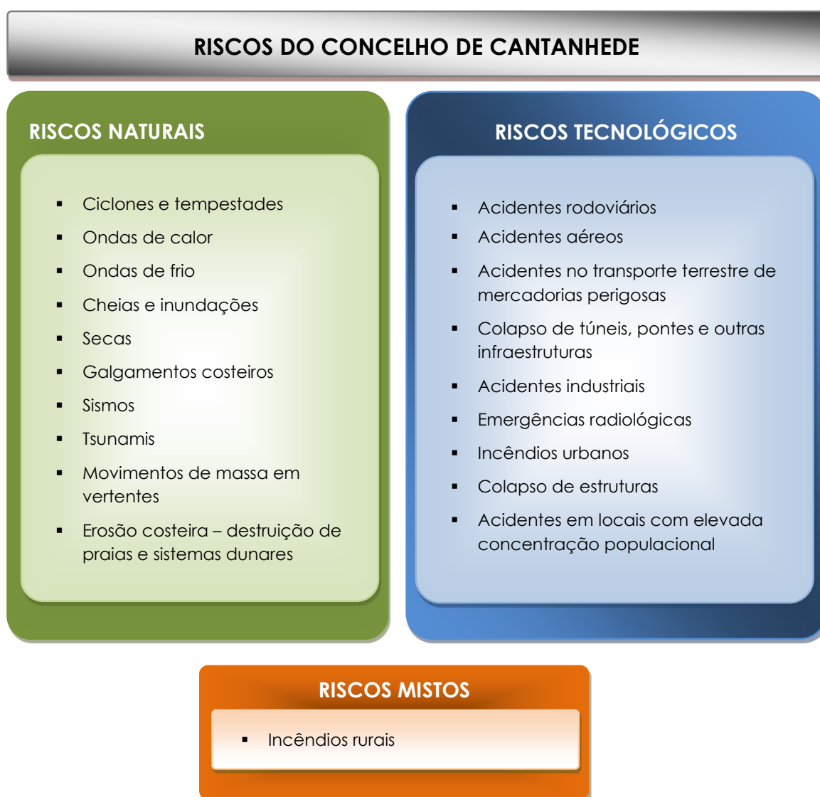
Figura 2. Riscos de origem natural, tecnológica e mista que podem afetar o concelho de Cantanhede

Neste sentido, de acordo com a caracterização do território municipal e a análise de riscos detalhadas no Anexo III, identificam-se na Cantanhede.